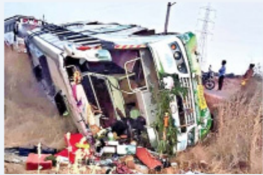
గాయపడిన వారిలో ముగ్గురి పరిస్థితి విషమంగా ఉండటంతో మెరుగైన చికిత్స కోసం ప్రాద్దుటూరు జిల్లా ఆసుపత్రికి తరలించినట్లు అధికారులు తెలిపారు. పోలీసులు కేసు నమోదు చేసి దర్యాప్తు చేస్తున్నారు. ఈ ఘటనలో ప్రాణహయం తప్పడంతో అందరూ ఊపిరిపీల్చుకున్నారు

కడప జిల్లాలో పెనుప్రమాదం తప్పింది. 40 మంది భక్తులతో వెళుతున్న టూరిస్టు బస్సు జమ్మలమడుగు - కన్యకీర్తిం ప్రధాన రహదారిపై ప్రమాదానికి గురైంది. ఈ ఘటనలో తొమ్మిది మంది భక్తులు గాయపడ్డారు. అన్నమయ్య జిల్లా రైల్వేకోడూరు నుంచి ప్రైవేటు బస్సులో 40 మంది భక్తులు జమ్మలమడుగు మండలం కన్యకీర్తిం దర్శనానికి వెళ్లారు అనంతపురం జిల్లా తాడివత్రి సమీపంలోని అలూరు రంగనాయకుల కోనకు బయలుదేరారు. ఈ క్రమంలో కొత్తగుంటపల్లె సమీపంలోని మలుపు వద్ద బస్సు స్టీరింగ్ అకస్మాత్తుగా పనిచేయకపోవడంతో అదుపుతప్పి రోడ్డు పక్కన బోల్తా పడింది.