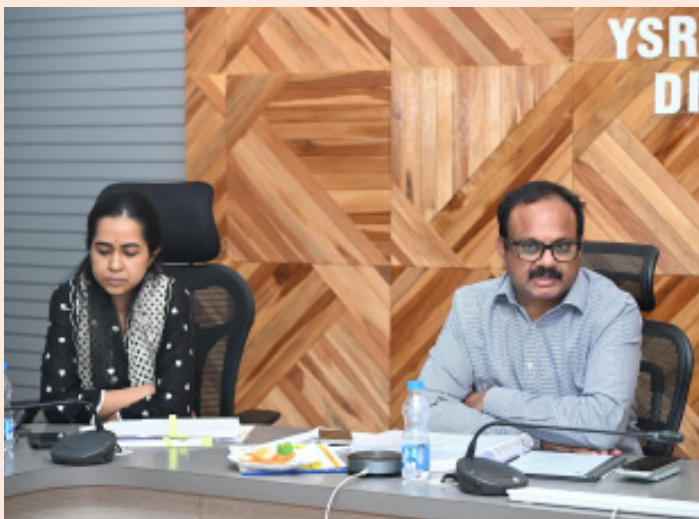
జిల్లా కలెక్టర్ రెవెన్యూ అధికారులను ఆదేశించారు. జిల్లా స్టాయి కార్యాలయం నుండి మండల, గ్రామ స్టాయి కార్యాలయాల వరకు అఫీషియల్ కరస్పాండెన్స్, ఉత్తర ప్రత్యుత్తరాలు, జీవోలు, మెమోలు, అన్ని రకాల కార్యకలాపాలకు సంబంధించి ప్రతి దాక్యుమెంట్ ను ఆన్ లైన్ లో అప్ లోడ్ చేయాలన్నారు. జిల్లా స్టాయిలో ప్రతి శాఖ వారి పరిధిలోని డివిజన్, మండల, గ్రామ స్టాయిలో అన్ని కార్యకలాపాలకు సంబంధించిన డేటాను స్టాన్స్ దాక్యుమెంట్ రూపంలో భద్రపరచాల్సిన అవసరం ఉందన్నారు.

కడప, ఫిబ్రవరి 10(భారత శక్తి) : దేశానికే ఆదర్శంగా నిలుస్తున్న పీ4 కార్యక్రమాన్ని జిల్లాలో పటిష్ఠంగా అమలు చేయడంతో పాటు అన్ని శాఖలు అన్ని పేరామీటర్లలో.. వందశాతం పురోగతిని సాధించేలా చర్యలు చేపట్టాలని జిల్లా కలెక్టర్ డా. శ్రీధర్ చెరుకూరి అధికారులను ఆదేశించారు.